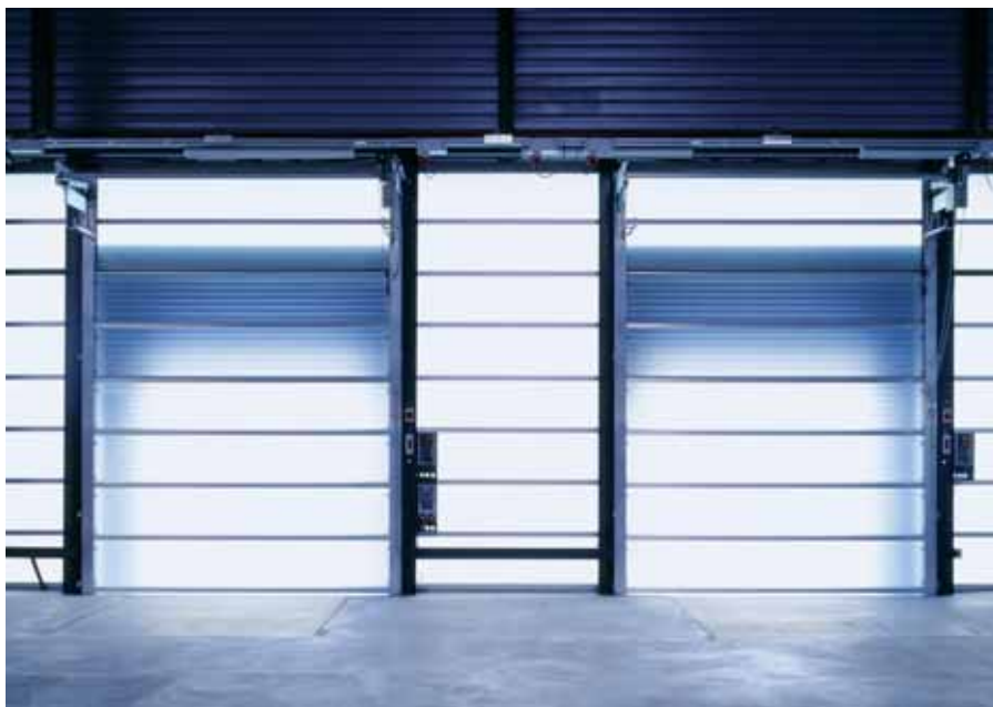
Приводы дверей и ворот — это лишь одна из многих областей применения преобразователей частоты новой серии FR-D700.