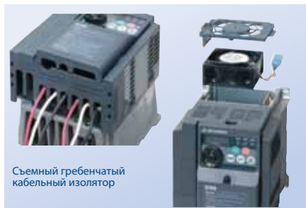
Съемный гребенчатый кабельный изолятор

Электромонтаж и замена вентилятора — без проблем